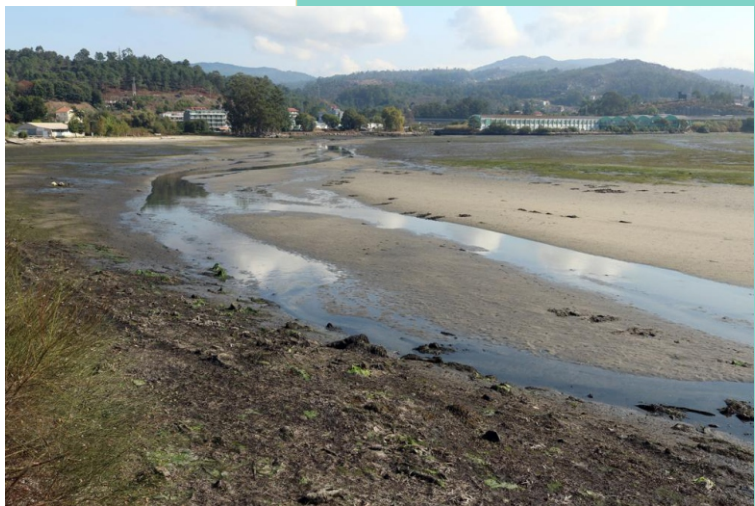
Desembocadura do río Ulló

É unha zona abrigada con augas pouco profundas, cunha enorme superficie de marismas que queda descuberta ao debalar o mar. Os espazos recollidos, pouco profundos, con sedimentos areosos e materia orgánica, son os lugares onde se atopan os bancos marisqueiros e as pradeiras de sebas. A fauna máis representativa é a mariña, moi rica en vermes, berberechos, ameixas, xibas... e as aves acuáticas.