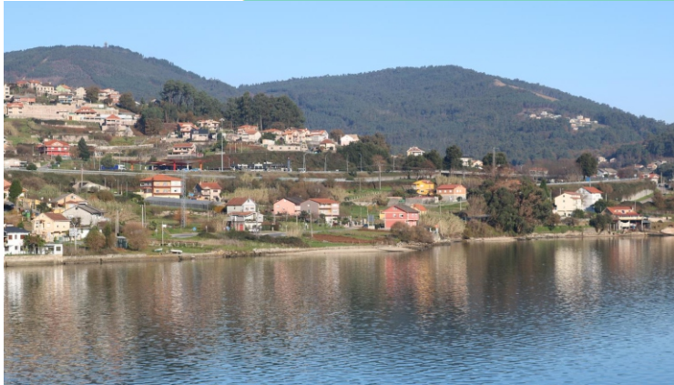
16-Praia da Pousada