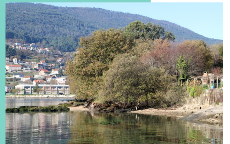
Vistas desde o peirao de Santa Cristina de Cobres