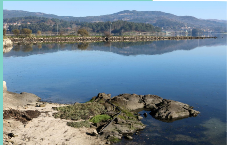
7-Peirao dos Caralletes