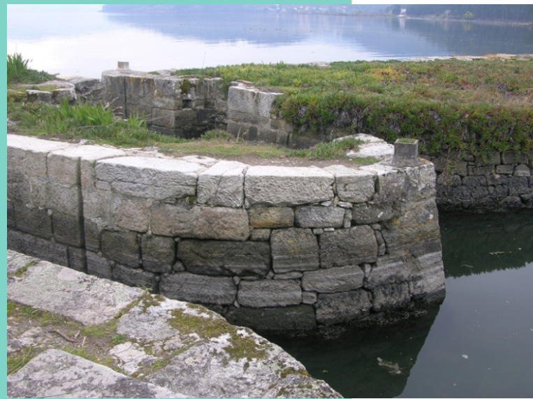
Muros do muíño de marea

Ao debalar o mar quedan ao descuberto marismas e areais. As marismas son hábitats de augas mornas e mansas onde bule a vida vexetal (algas verdes, sebas) e animal (miñocas que remexen o subtrato e se alimenta de residuos, como os cagóns ou arenícolas).