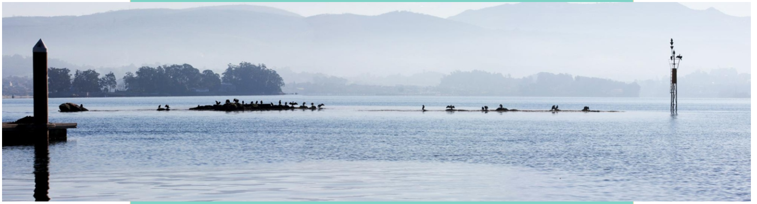
Pedra da Senhora ou da Oliveira