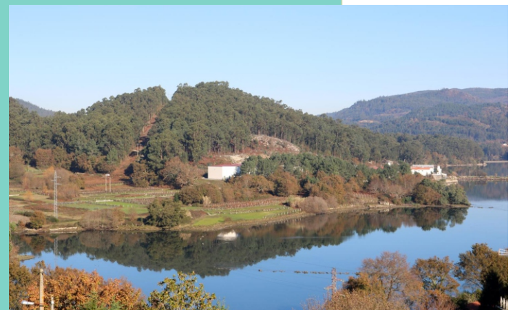
9-Enseada de Larache