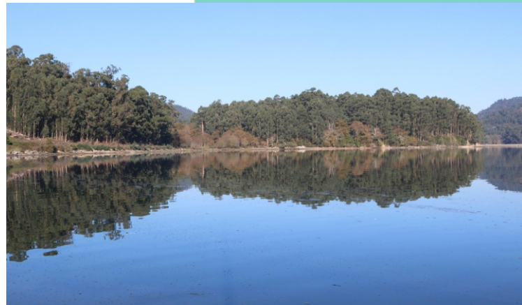
Punta das Saiñas