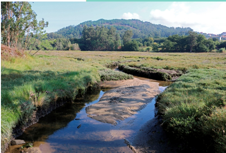
5-A Xunqueira (Río Tuimil)