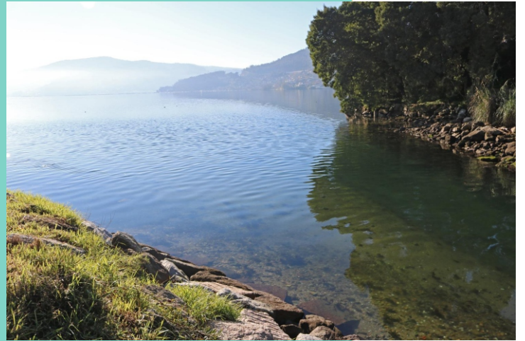
Desembocadura do rio Maior