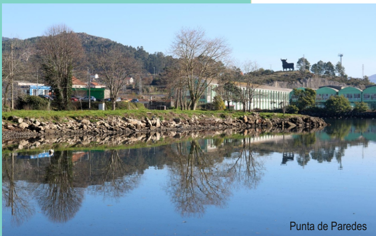
Punta de Paredes