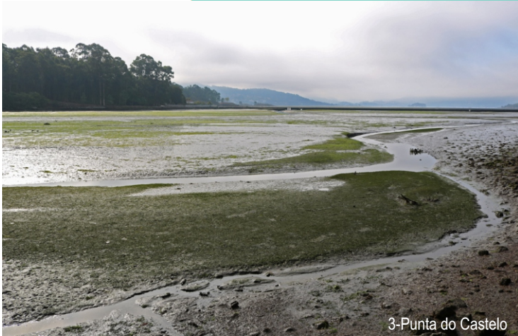
3-Punta do Castelo

Ao debalar o mar quedan ao descuberto marismas e areais. As marismas son hábitats de augas mornas e mansas onde bule a vida vexetal (algas verdes, sebas) e animal (miñocas que remexen o subtrato e se alimenta de residuos, como os cagóns ou arenícolas).