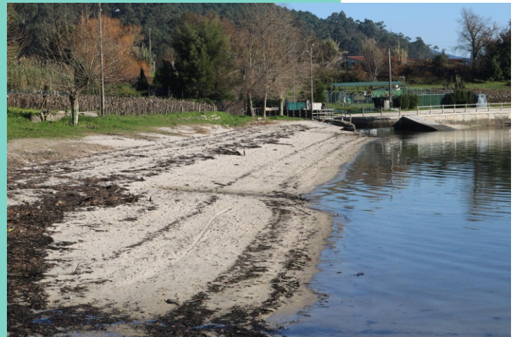
14- Praia de Deilán