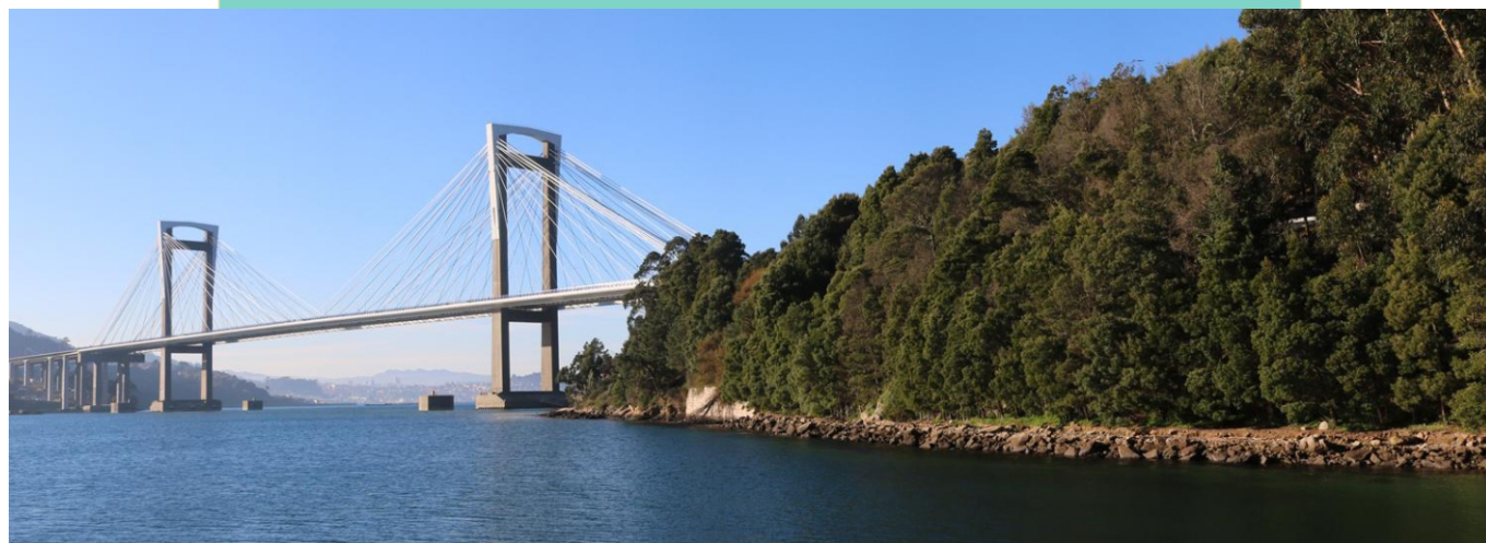
21-Punta do Aradoiro