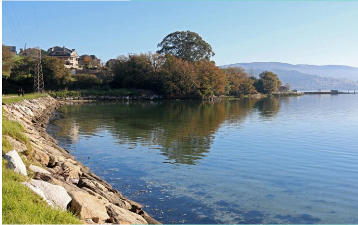
15-Praia de Riomaior