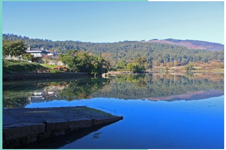
10-Enseada e praia de Larache