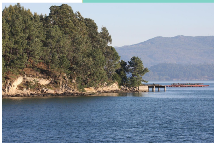
19-Punta de Santo Adrao