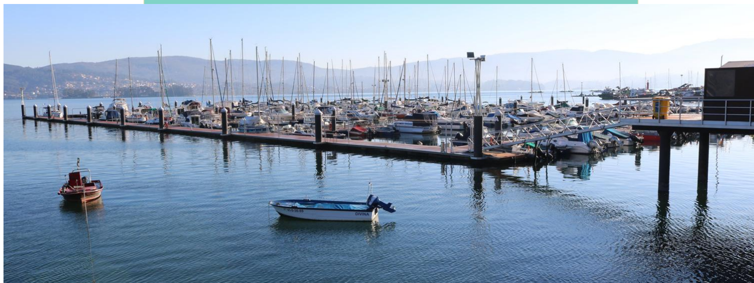
18-Peirao de Santo Adrao de Cobres