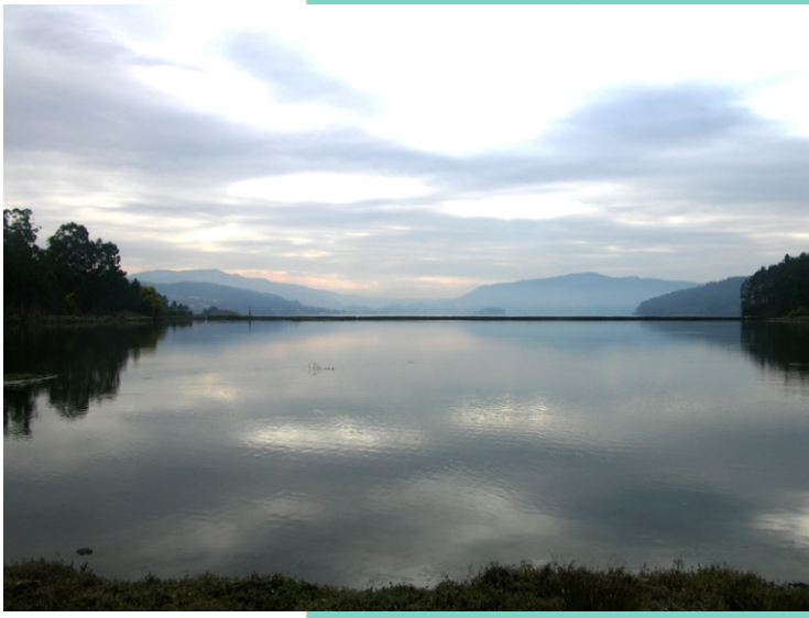
Auga retida no encoro do antigo muíño de Vilaboa.