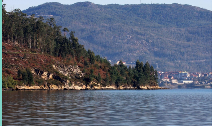
12-Punta do Cabalo