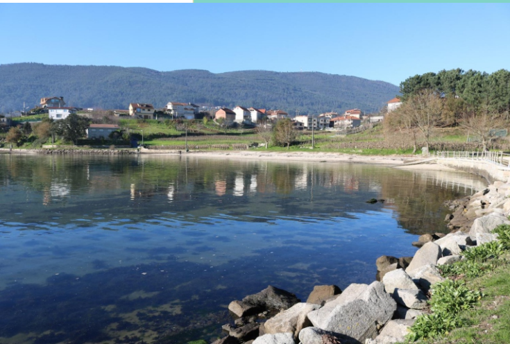
13-Punta de Pereiró