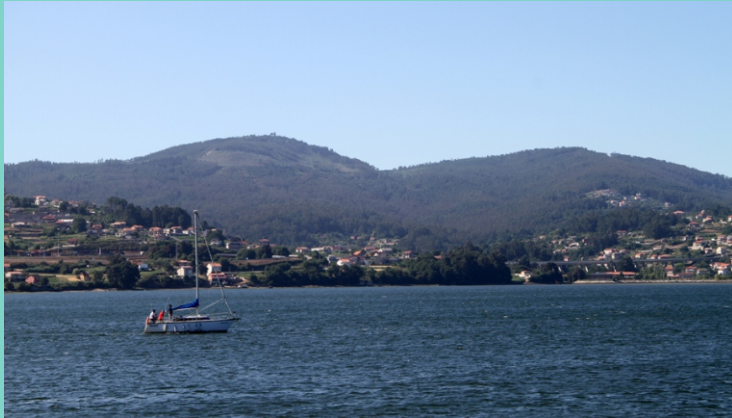
A costa de Vilaboa cos montes de Coto Redondo detrás.

Seguimos agora ata o desvío á praia de Riomaior , onde hai un pequeno paseo. Continuamos pola estrada con vistas á ría e poucos puntos de acceso ata chegar ao peirao de Santo Adrao de Cobres . A última parada facémola na Punta da Travesada , onde se atopa a praia do Forno do Cal e desde onde podemos ver a punta do Aradoiro , xa debaixo do arranque da ponte de Rande , final do traxecto e do concello de Vialaboa.