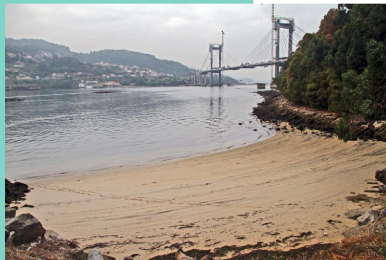
20-Praia do Forno do Cal na punta da Travesada.