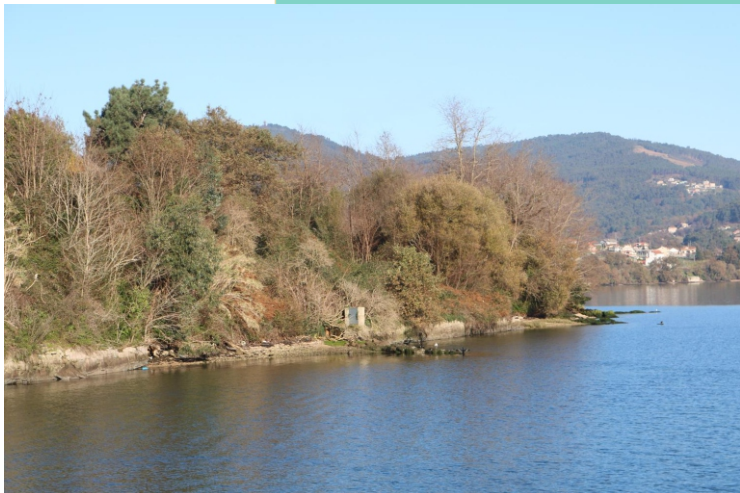
17-Punta e Praia do Estralo